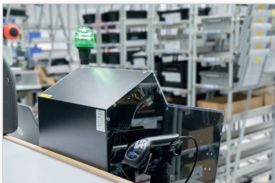
Prüfplätze in der Fertigung