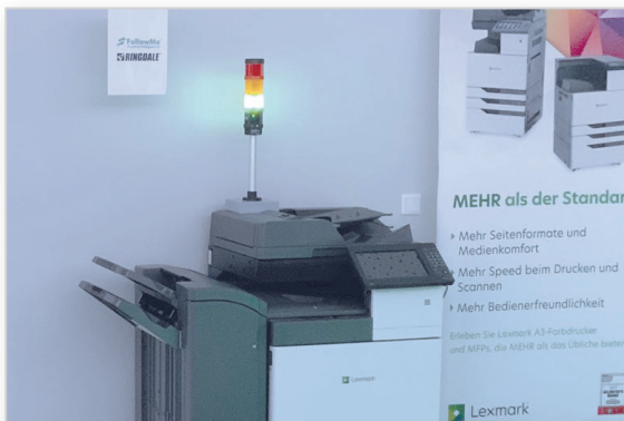
Drucker im Office oder in der Fertigung