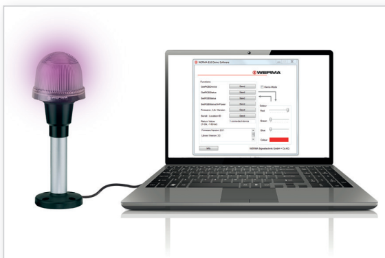
LED-Leuchte in Call-Centern