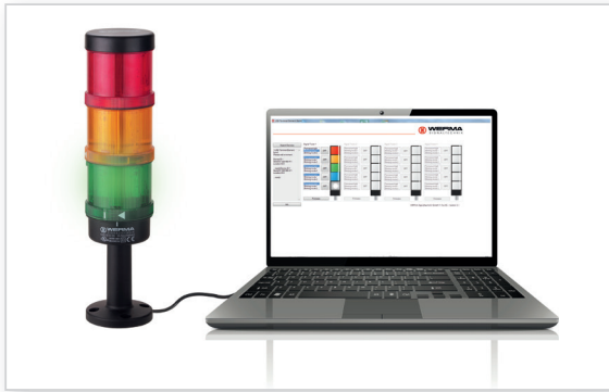
Signalsäule in Call-Centern