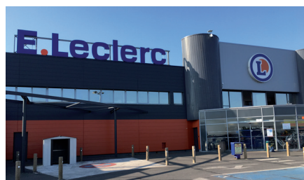
Leclerc: un'innovativa esperienza d'acquisto La catena di supermercati francese Leclerc conta più 560 outlet in tutta la Francia.

lavorano in un'area di 6000 mq con l'obiettivo di offrire ai propri clienti la più piacevole esperienza d'acquisto possibile. Questa filiale è un fiore all'occhiello nella catena dell'azienda e combina una presentazione e un'esposizione ottimizzata dei prodotti e un'ampia gamma di articoli in un'atmosfera di shopping moderno, utilizzando le più recenti tecnologie per soddisfare l'esperienza di shopping.