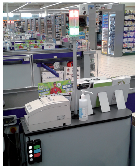
Particolare della colonnina luminosa di WERMA

Il software di WERMA permette di avere una chiara visione delle situazioni alle 21 casse con un semplice colpo d'occhio